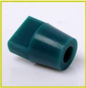
N17S-L Bouchon silicone à languette