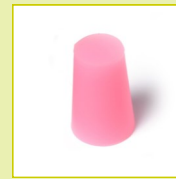
N17S Bouchon en silicone