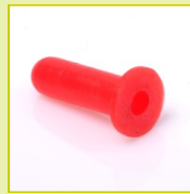
N32 Protecteur pour base de goujon