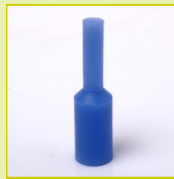
N19 Cylindrique s'adaptant aux trous filetés ou lisses