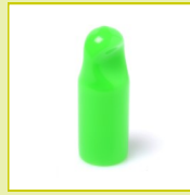
N14GT Protecteur souple à languette