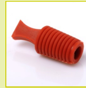
N23 Bouchon conique strié