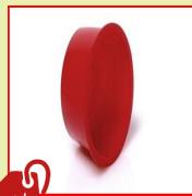
N100TS Cape conique silicone HT