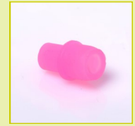
N24 Cape à languette pour taraudage