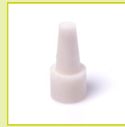
N21 Bouchon à collerette