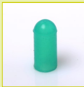
N31 Protecteur pour tête de vis et tube