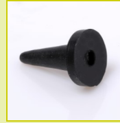
N22 Bouchon creux à collerette