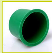
N101 Cape conique HT