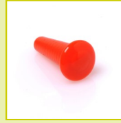
N16 HT Petit bouchon conique PVC