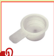
N26 HT Bouchon à languette HT