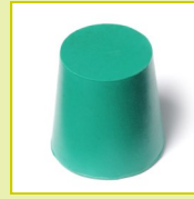
N17N Bouchon en néoprène