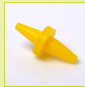
N20 Bouchon double à collerette