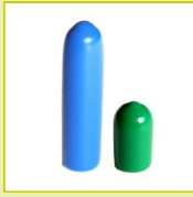
N10-N11 Protecteur souple rond HT