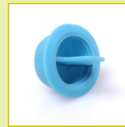
N132 Bouchon à languette centrale