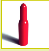
N14 HT Protecteur souple à tétine HT